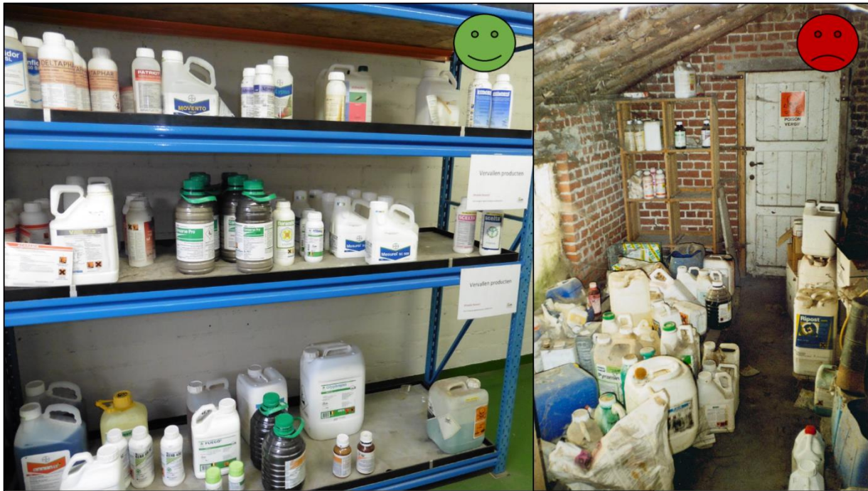
Figuur 1: Het fytolokaal links, met duidelijk geordende producten en legplanken met opstaande randen, beperkt de risico's en de kans op het maken van fouten. Het fytolokaal rechts vormt een gevaar voor de gebruiker van de producten en het milieu.