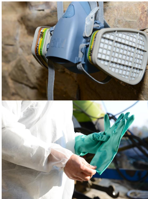
Figuur 3: Persoonlijke beschermingsmiddelen zorgen ervoor dat je gezondheid maximaal beschermd wordt tijdens het werken met gewasbeschermingsmiddelen. Een masker met een filter met bruine markering absorbeert de dampen en een overall, handschoenen en laarzen verhinderen direct contact met het product.

Bij het werken met GBM is het belangrijk om ook je persoonlijke veiligheid te bewaken. Voorzie steeds een propere overall, degelijke laarzen, nitrile of neopreen handschoenen en een veiligheidsbril die je enkel voor het toepassen van GBM gebruikt. Vermijdt ook dat je giftige dampen inademt, door een masker te dragen met een filter voor organische dampen (bruine kleurcode). Deze filter dient regelmatig te worden vervangen en mag niet vervallen zijn. Je persoonlijke beschermingsmiddelen moet je ook buiten het fyto-lokaal bewaren om te vermijden dat ze verontreinigd geraken, of de filters verzadigd raken door de dampen.