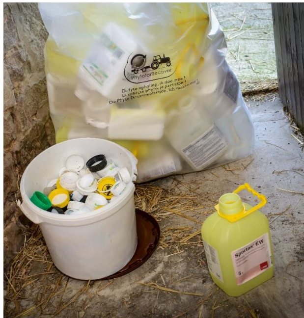
Figuur 2: Bij een goed beheer van de lege verpakkingen worden de bussen uitgespoeld, gedroogd en bewaard in daarvoor voorziene zakken van Agrirecover. Doppen worden afzonderlijk verzameld. Zegels vallen, net als vervuild verpakkingsmateriaal zoals zakken of dozen onder de niet-spoelbare fractie.

De opslag van de lege verpakkingen moet niet noodzakelijk in het fytolokaal, maar kan ordelijk op een andere plaats op het bedrijf. Deze sorteert je zoals het hoort. Gebruik bij voorkeur de zakken die door AgriRecover worden aangeboden.